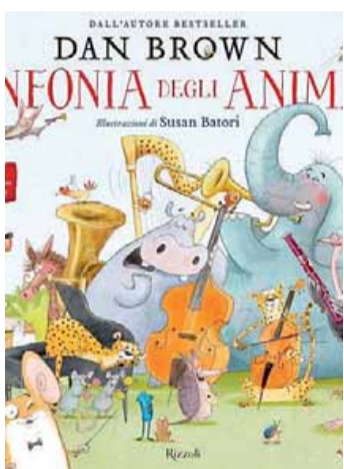
• La sinfonia degli animali

I suggerimenti. La nostra panoramica d'inizio mese per i più piccoli spazia dalle immancabili pagine nel segno della fantasia "colorata" alle lezioni utili in forma divertente per scoprire come è fatto il mondo