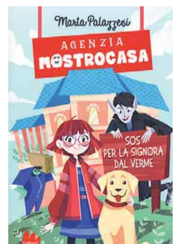
• Agenzia mostrocasa