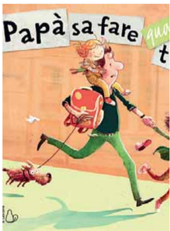
• Papà sa fare quasi tutto