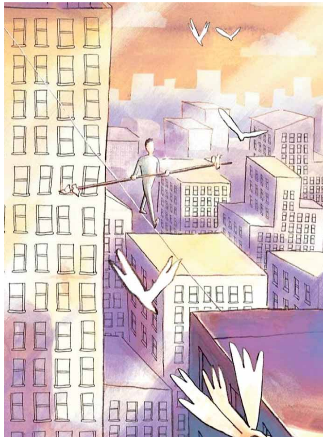
• Illustrazione di Davide Aurilia da "Storia funambola" di Chiara Ingrao, Edizioni Corsare

immaginare e di scegliere chi si vuole essere, al di là dei ruoli imposti. Stella non vuole vestirsi di rosa, ama arrampicarsi ovunque e sogna di fare la funambola, proprio come quel tipo matto visto in televisione che camminava in equilibrio su una corda fra due grattacieli. Un giorno crea con i lego una costruzione colorata piena di fili sospesi: una bellissima Terra funambola! Al suo interno vivono i Pac, sette pupazzetti minuscoli e morbidi perfetti per fare capriole e compiere acrobazie. Ma se i Pac cominciarono all'improvviso a parlare e la casa di mattoncini crescesse a dismisura, trasformandosi in un mondo formicolante di segreti? Una prima lettura autonoma pensata per bambine e bambini dai 7-8 anni, ma risulta perfetta anche come lettura ad alta voce già a partire dalla fine della scuola dell'infanzia.