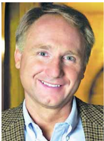
• Dan Brown