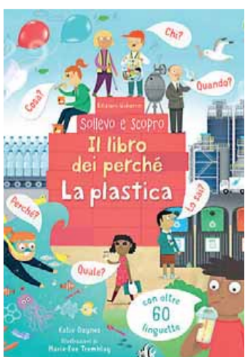
• Il libro dei perché - La plastica