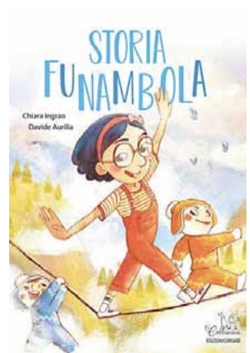
• Storia funambola